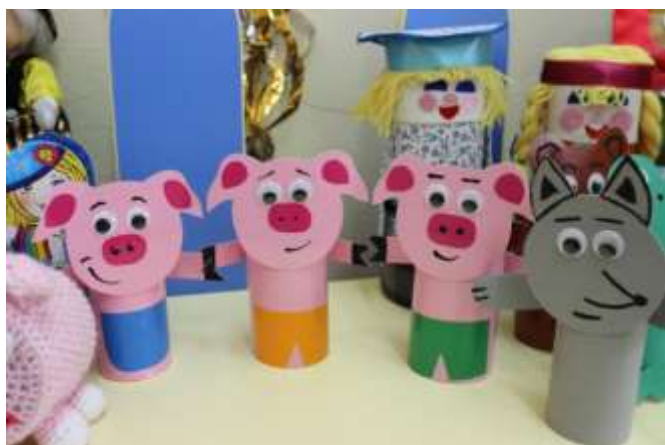
«Игрушки из цилиндров»