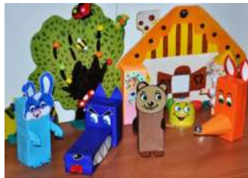
«Куклы из коробок»